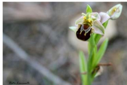
Foto: Costantino Laureanti, presso Bosco di Santo Pietro. E' vietata la riproduzione anche parziale di queste pagine e dei suoi contenuti.

Questa Brochure può essere citata: Laureanti Costantino, Renato Carella (2014). Pubblicazione online.