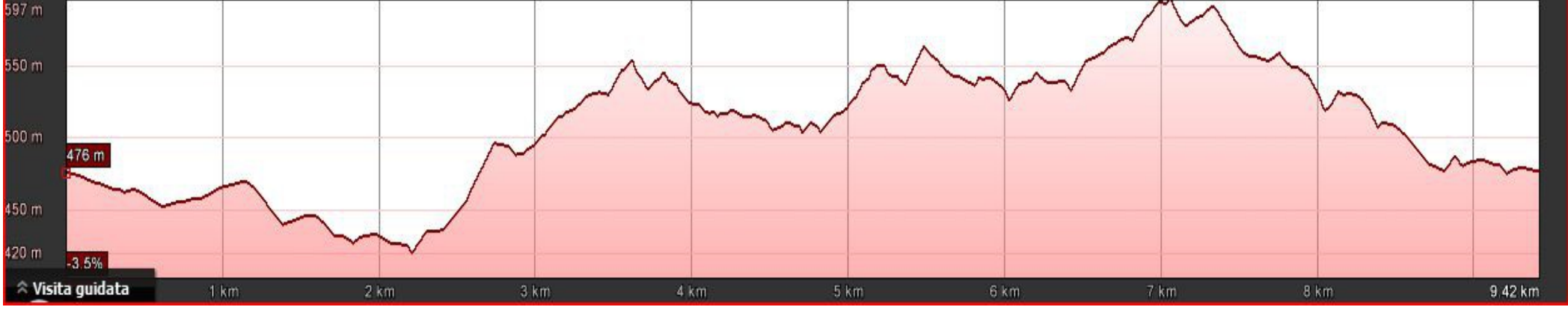
Grafico: min, med, max Elevazione: 420, 507, 597 m Totali intervallo: Distanza: 9.42 km Guadagno/perdita in elev.: 436 m, -436 m Pendenza max: 26.3%, -29.7% Pendio medio: 8.7%, -8.3%

Data di acquisizione delle immagini: 7/29/2013 Lat 37.155188° Lon 14.908922° elev 586 m alt 3.20 km